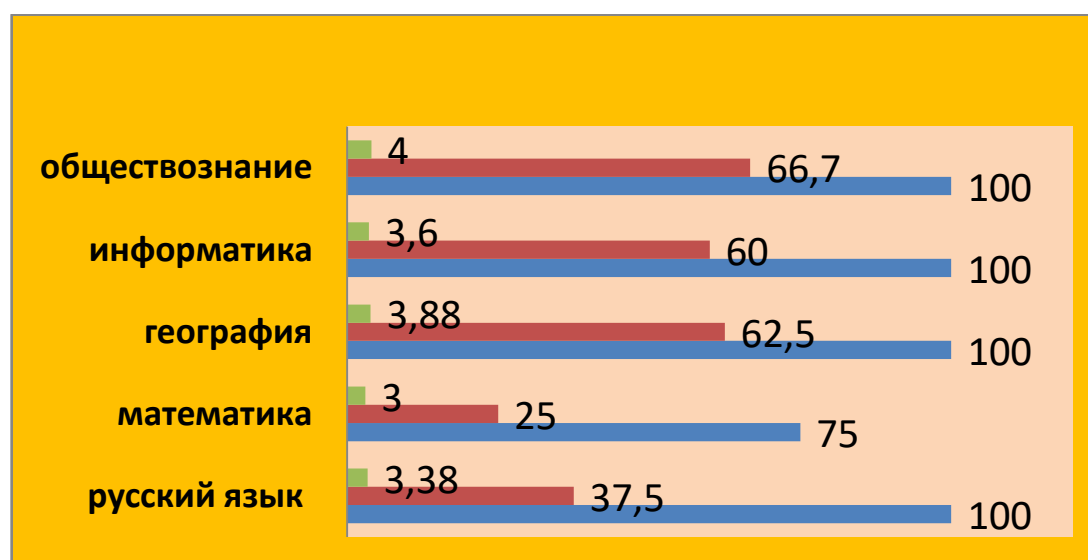
Таблица 3.Итоги ОГЭ по предметам за 2022-2023 учебный год по МОУ СОШ д. Аксакшур

Из таблицы видно, что хорошие результаты по выбранным предметам